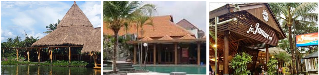
Gambar 4. Restoran dengan ciri atap dan material tidak sepenuhnya Jawa: Mang Engking (34 poin), Banyu Mili Resto (25 poin), Jejamuran (19 poin). Sumber: https://www.tripadvisor.com/ , https://traveloka.com/ , https://www.jogjakita.co.id/