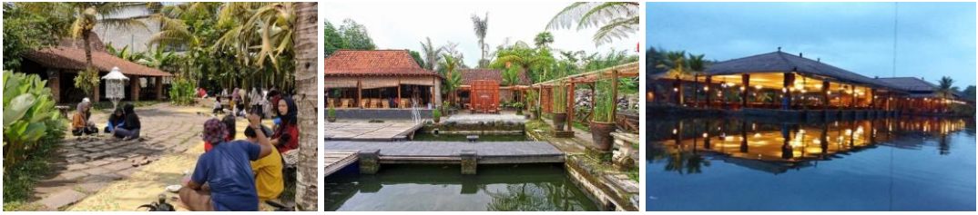
Gambar 3. Restoran dengan ciri atap dan material Jawa: Kopi Klotok (32 poin), Raminten Jakal (29 poin), Westlake Resto (29 poin).