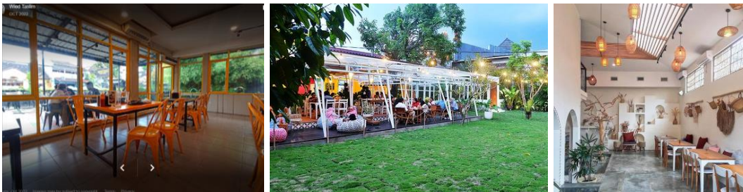
Gambar 5. Restoran dengan gaya modern: Waroeng Steak Perumnas (15 poin), Nanamia Pizzeria Prawirotaman (14 poin), Kalluna (11 poin).

Dari ketujuh aspek “ATUMICS”, kedua aspek yang sudah ditilik ( Material dan Shape ) belum menunjukkan aplikasi nilai-nilai budaya yang lebih dalam. Hal ini belum dapat dilakukan karena keterbatasan media observasi. Observasi langsung di masa yang akan datang akan dapat lebih memudahkan penilaian dan analisis terkait elemen-elemen pada bangunan secara lebih komprehensif.