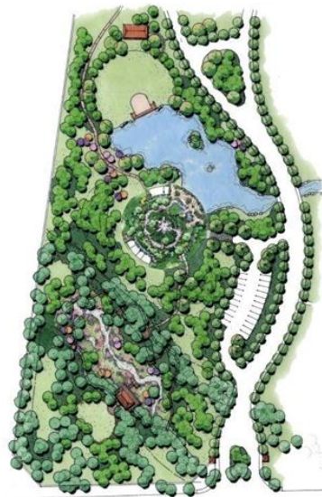
Gambar 4. Biodiversitas pada desain lanskap

Lebih jauh, desain berbasis biodiversitas juga mendukung prinsip pembangunan berkelanjutan dengan mengurangi ketergantungan terhadap sumber daya buatan, meningkatkan resiliensi lingkungan terhadap perubahan iklim, dan mendukung keseimbangan ekologis jangka panjang. Oleh karena itu, pendekatan ini tidak hanya relevan untuk kawasan konservasi tetapi juga penting untuk diterapkan pada kawasan rekreasi, edukasi, hingga pengembangan kawasan wisata seperti theme park . Dengan demikian, lanskap tidak hanya menjadi tempat rekreasi, tetapi juga medium konservasi dan pembelajaran ekologis yang mampu menumbuhkan kepedulian terhadap alam secara holistik.