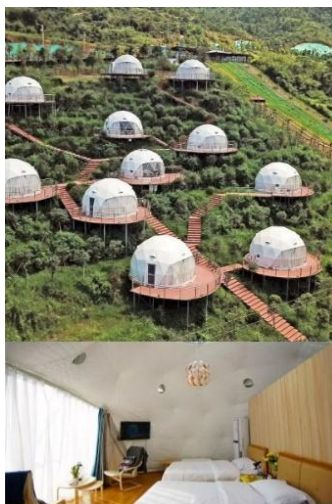
Gambar 6. Contoh perancangan cottage/camp ground