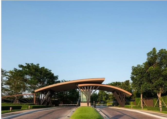
Gambar 7. Contoh perancangan Gate Entrance