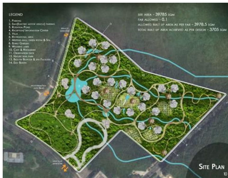
Gambar 3. Konsep Eco Tourism

Eco-tourism didefinisikan sebagai bentuk pariwisata yang bertanggung jawab terhadap alam yang bertujuan untuk menikmati dan menghargai lingkungan alami serta budaya setempat dengan cara yang meminimalkan dampak negatif (Fennell, 2008). Konsep ini menekankan tiga aspek utama, yaitu pelestarian lingkungan, partisipasi masyarakat lokal dan edukasi bagi wisatawan. Dalam konteks perancangan ruang, eco-tourism mendorong praktik desain yang rendah emisi karbon, hemat energi serta mendukung keberadaan ekosistem alami. Eco-tourism juga mengutamakan pengalaman yang autentik dan berkelanjutan, serta memberikan manfaat ekonomi bagi komunitas lokal tanpa merusak lingkungan.