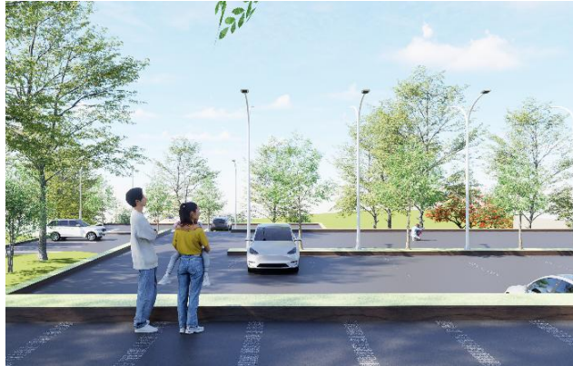
Gambar 9. Contoh perancangan area parkir