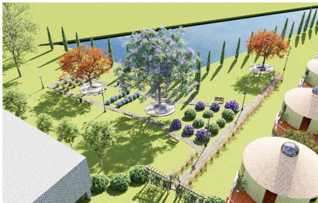
Gambar 10. Contoh perancangan area taman bunga