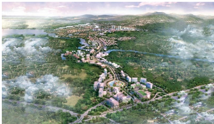
Gambar 1. Masterplan Kawasan Kota Baru Parahyangan

Tapak perancangan terletak di kawasan Kota Baru Parahyangan, Kabupaten Bandung Barat, Jawa Barat, dengan luas ±5 Ha. Kawasan ini merupakan kota mandiri yang terencana dengan baik, memiliki infrastruktur modern, sistem utilitas yang lengkap, dan tata ruang yang tertata rapi. Posisi tapak sangat strategis karena berada di jalur utama Jalan Parahyangan yang menjadi akses penghubung antara Tol Purbaleunyi ( Exit Tol /Padalarang) dan pusat kawasan Kota Baru Parahyangan. Kawasan ini juga didominasi oleh fungsi komersial, pendidikan, dan rekreasi yang menjadikannya pusat aktivitas masyarakat sekitar maupun pengunjung dari luar daerah.