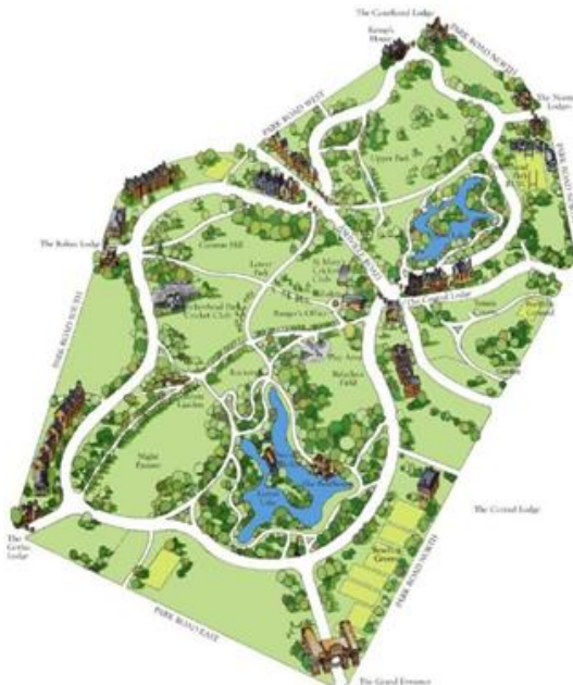
Gambar 5. Theme Park

Dengan mengemas informasi ilmiah dalam bentuk yang menyenangkan dan pengalaman langsung yang menyentuh emosi, theme park berbasis edukasi lingkungan tidak hanya mampu menarik minat pengunjung, tetapi juga menanamkan kesadaran jangka panjang akan pentingnya menjaga keseimbangan ekologi. Oleh karena itu, theme park memiliki potensi besar sebagai media pembelajaran non-formal yang inklusif, efektif, dan berkelanjutan, terutama dalam mendukung agenda global seperti pembangunan berkelanjutan dan pendidikan lingkungan untuk semua ( Education for Sustainable Development ).