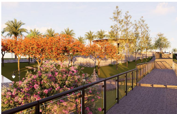
Gambar 8. Contoh perancangan skywalk