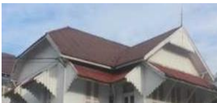
Gambar 4. Hiasan puncak pada Pendopo Bupati Aceh Timur

Gaya arsitektur peralihan berlangsung antara tahun 1890-1915, sehingga arsitektur ini tidak sering diperhatikan. Hal ini disebabkan masa peralihan dari abad 19 ke abad 20 di Hindia Belanda banyak perubahan kala itu. Mulai dari modernisasi penemuan baru dalam bidang teknologi maupun perubahan sosial dampak dari kebijakan pemerintah kolonial mengakibatkan perubahan bentuk dan gaya dalam arsitektur. Karakter arsitektur bangunan ini merupakan hasil penggabungan dari arsitektur yang berkembang di Belanda dengan menyesuaikan iklim tropis basah Indonesia.