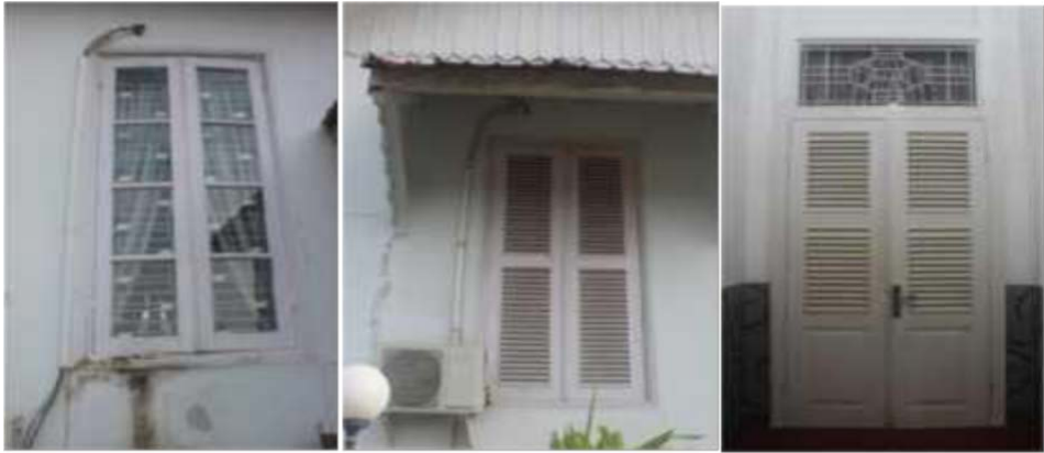
Gambar 5. Bentuk pintu dan jendela pada Pendopo Bupati Aceh Utara

Pintu, jendela dan plafond yang tinggi merupakan ciri dari arsitektur kolonial yang berfungsi untuk memperlancar sirkulasi udara pada bangunan. Di tambah overstek di bagian luar bangunan pada atas pintu dan jendela untuk menghindari ritsan hujan dan sinar matahari langsung masuk ke dalam bangunan.