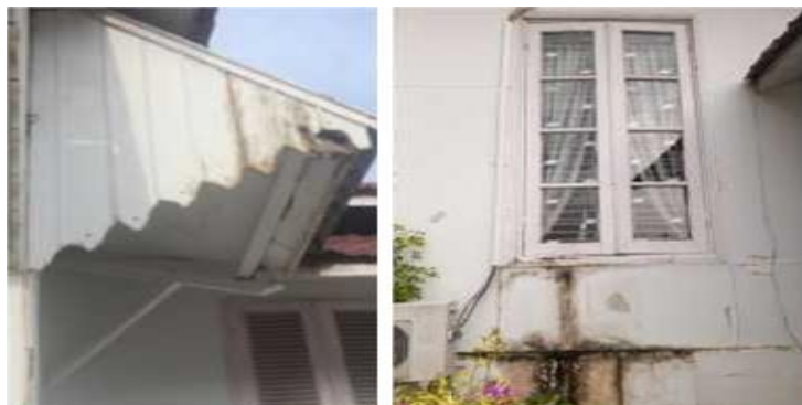
Gambar 6. Overstek yang sering terkena tempiasan hujan dan bagian bawah jendela yang berlumut karena terkena air sisa AC.

Pintu, jendela dan plafond yang tinggi merupakan ciri dari arsitektur kolonial yang berfungsi untuk memperlancar sirkulasi udara pada bangunan. Di tambah overstek di bagian luar bangunan pada atas pintu dan jendela untuk menghindari ritsan hujan dan sinar matahari langsung masuk ke dalam bangunan.