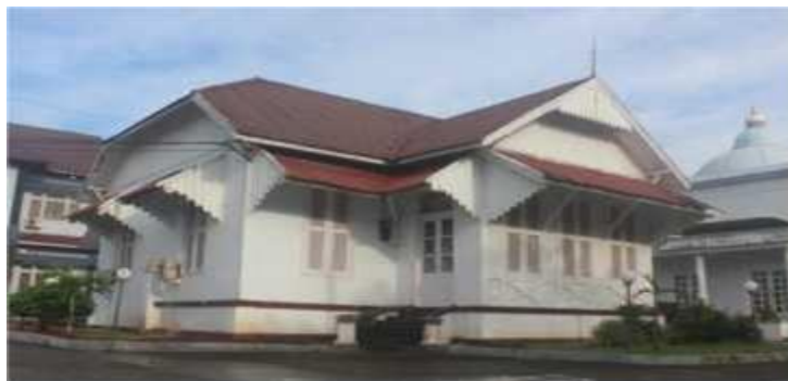
Gambar 2. Perspektif Pendopo Bupati Aceh Timur

Setelah kemerdekaan pada tahun 1946, afdeeling Aceh Timur yang dikepalai oleh asisten residen menjadi kabupaten Aceh Timur dan dikepalai oleh Bupati. Onderafdeeling Idi yang dikepalai oleh controleur menjadi menjadi asisten kewedanaan Idi yang di pimpin Pembantu Bupati. Pada tahun 2002 Aceh Timur dimekarkan menjadi Kabupaten Aceh Tamiang dengan Ibukota Kuala Simpang, Kota Langsa Ibukota Langsa dan Aceh Timur berpindah Ibukota dari Langsa ke Idi Rayeuk. Setelah pemekaran, Kabupaten dikepalai langsung oleh Bupati dan tidak ada asisten kewedanaan.