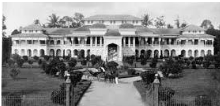
Gambar 2. Tampak Depan Istana Maimun

Adapun, pada dasarnya bentuk atap rumah adat kepulauan Indonesia Timur memang mirip bentuk perahu tertangkup (terbalik). Atap rumah mendominasi bentuk bangunan, sehingga orang menamakannya sebagai arsitektur atap. Dalam filosofis (Sumardjo) paradoks Melayu mengatakan bahwa Atap adalah simbol Dunia Atas, sehingga rumah menekankan kehadiran Dunia Atas di dunia manusia.