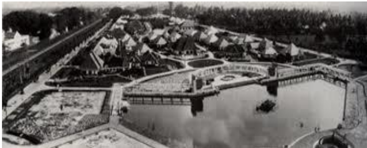
Gambar 4. Taman Sri Deli ( Derikanpark ), terletak di sebelah Masjid Raya Al-Mahsun

Sri Deli yang dulunya bernama Delikanpark merupakan salah satu taman yang dibangun pada 1924 atas perintah Sultan Amaludin Sani Perkasa Alamsyah.