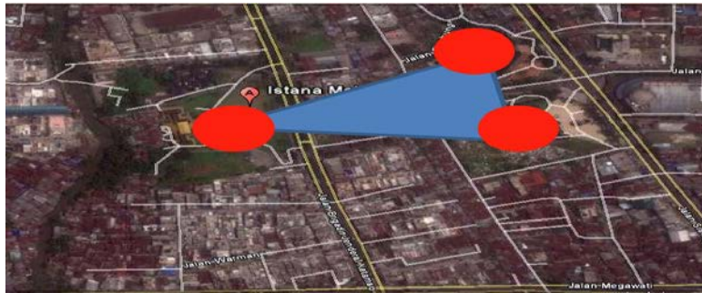
Gambar 1. Tampak atas tiga kawasan Istana-Mesjid-Taman

Konsep desain arsitektur istana Maimun, penggabungan desain gaya-gaya arsitektur dari Arab, Belanda dan Melayu. Penggabungan ketiga gaya ini menjadi satu kesatuan yang harmoni pada Istana yang terkesan megah dan menyimbolkan kekuasaan raja pada itu. Pada masa kerajaan Sultan Al-Rasyid Alamsyah, perekonomian di Medan sangatlah bagus, terbukti adanya ekspor tembakau dalam bentuk cerutu sampai ke negeri Belanda. Kualitas dari tembakau Deli terdengar samapai ke penjuru dunia menjadikan perkebunan tembakau sangat jaya dan maju saat itu. Itulah sebabnya raja memerintahkan arsitek dari Belanda saat itu untuk memdesain dan membuat istana yang hingga kini dinamakan istana Maimun. Kesatuan struktural yang bercorak dinamis terdapat pada fasad bangunan istana yang serasi dan seimbang. Dalam teknologi dan keserasian disebut focus atau vision kebudayaan yang menjamin kesatuannya. Kesatuan yang kuat pada struktur bangunan terlihat pada tiang-tiangnya sebagai penyangga bangunan, konfigurasi atap dengan gaya arsitektur India. Konsep itu yang diambil untuk menganalisa kesatuan yang lebih dalam. Konsep jiwa kebudayaan dipakai untuk menetapkan kesatuan kesatuan tidak pula berupa pendekatan tepat arena bersifat anthromorf , bahkan animistis dan membutuhkan sekian banyak transposisi dan koreksi. Untuk menunjukkan dan menguji kesatuan kebudayaan lebih tepat dipakai struktur atau konfigurasi (Bakker, 1984).