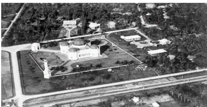
Gambar 3. Tampak atas kawasan Masjid Raya Al-Mahsum

(bentuk atap terbalik) terakhir ini sebenarnya pseudo -perahu, karena lunasnya justru melebar dan permukaan perahu berbentuk lunas yang sesungguhnya. Sama halnya dengan kondisi yang berada di Sumatera Timur. Dengan demikian, atap pola perahu yang sesungguhnya hanya terjadi di masyarakat primordial kepulauan Indonesia bagian timur, yang merupakan masyarakat maritim-peladang yang sesungguhnya. Sedangkan bentuk atap pseudo -perahu terdapat di masyarakat peladang yang kemudian tumbuh menjadi maritim atau sebaliknya. Medan yang terletak di pesisir timur Sumatera, dengan kondisi alamnya yang memiliki arsitektur Melayu. Pada Masjid Raya, sama halnya seperti gaya arsitektur Istana. Mersjid ini dibangun setahun setelah Istana didirikan yaitu pada tahun 1889. Istana di bangun atas keinginan raja yang juga beragama Islam. Peninggalan Sultan Deli di Sumatera Utara yang yakni Sultan Ma'moen Al Rasyid Perkasa Alam ini memiliki nilai sejarah yang tinggi serta sangat monumental. Luas Bangunan masjid tersebut mencapai 5000 meter persegi, serta dibangun di atas lahan dengan luas 18000 meter persegi. Pembangunan masjid raya tersebut telah menghabiskan waktu 3 tahun lamanya, yakni mulai dari 21 agustus 1906 hingga 19 september 1909. Masjid raya tersebut telah berusia lebih dari 1 abad.