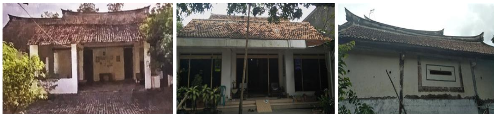
Gambar 3. Atap rumah Pecinan Lasem

Bentuk atap arsitektur pecinan paling mudah ditengarai termasuk di pecinan Lasem. Bentuk atap Cina yang digunakan di Lasem adalah jenis atap pelana dengan ujung yang melengkung keatas yang disebut sebagai model Ngang Shan . Menurut Pratiwo (2010:212), jenis ekstensi atap yang terdapat di rumah Lasem yaitu ekor burung wallet (pucuk jerami). Bentuk atap pada gerbang rumah Lasem memiliki kesamaan dengan atap yang terdapat pada rumah. Hanya atap pada gerbang dimensinya lebih kecil dan bentuk lebih sederhana jika dibandingkan atap rumah utama.