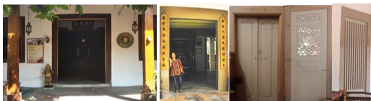
Gambar 7. Elemen Pintu dan Jendela Rumah di Pacinan Lasem

Elemen pelengkap seperti pintu dan jendela pada rumah pecinan Lasem berbahan dasar kayu jati. Bentuk dan ukurannya bermacam-macam. Yang membedakan rumah pecinan Lasem dengan modern, untuk rumah-rumah di Pecinan, elemen pintu dan jendela kebanyakan belum menggunakan kaca.