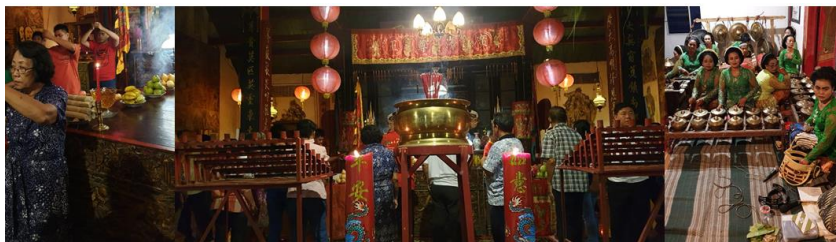
Gambar 8. Aktivitas kelenteng di Pacinan Lasem

Dalam struktur kekerabatan pada warga pecinan keluarga memegang peranan penting dibandingkan kepentingan individu. Keluarga yang terdiri dari orangtua dan anak dengan dasar menarik garis keturunan dari ayah ( patrilinear ) merupakan struktur dasar sosial dari masyarakat Cina. Tiap marga/klan biasanya bermukim pada kampung yang sama. Dimana pada pola perumahan masyarakat Cina, tempat tinggal bukan dipandang sebagai tempat utama untuk dihuni anggota keluarga secara individu tetapi lebih dianggap sebagai lambang persatuan dan status sosial bagi keluarga besar semarga baik yang masih hidup maupun yang sudah mati. Hal ini terwujud dalam bakti arwah leluhur melalui altar pemujaan yang banyak terdapat di ruang depan rumah-rumah masyarakat Cina. Adanya altar atau tempat pemujaan inipun tak lepas dari religi masyarakat.