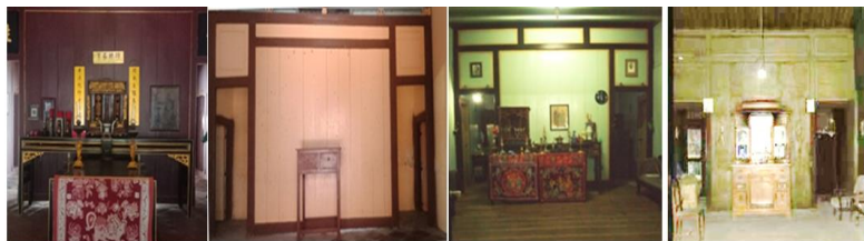
Gambar 6. Elemen Dinding Rumah di Pacinan Lasem

Rumah tinggal di pecinan Lasem dapat pula dilihat dari penggunaan bahan dindingnya. Bahan dinding kayu menjadi ciri khas rumah tersebut terutama untuk dinding ruang altar. Karena di Lasem terdapat hutan jati yang memungkinkan penggunaan kayu pada saat itu. Namun sesuai perkembangan jaman rumah-rumah mulai berdinding permanen, yaitu dengan bahan batu-bata, yang di finish dengan cat.