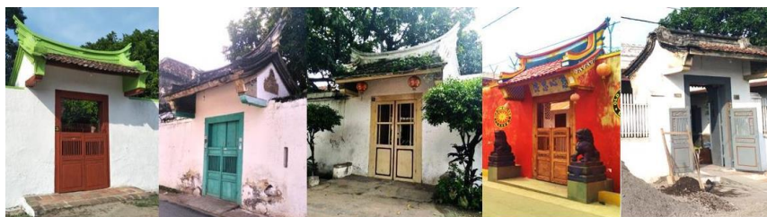
Gambar 4. Pintu Gerbang berupa gapura di Pacinan Lasem

Rumah tinggal pecinan Lasem diawali dengan pintu gerbang yang terletak satu garis dengan pintu masuk bangunan serta altar. Sumbu ini memenuhi nilai simetri bangunan yang membagi rumah menjadi dua bagian yang sama dan menjadi ciri khas arsitektur rumah tinggal Cina. Secara umum bentuk gerbang yang ada di Lasem dibedakan dua jenis, yaitu 1) gerbang yang berbentuk gapura, 2) gerbang yang berbentuk rumah. Bentuk gapura memiliki dinding pagar yang mengitari bangunan secara keseluruhan dan memiliki ketinggian hampir setinggi dinding rumah. Pintu yang digunakan biasanya memiliki model dua pintu dimana umumnya terpasang nama pemilik rumah.