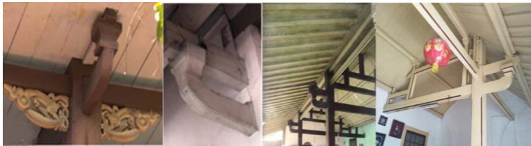
Gambar 5. Tou Kung Rumah di Pacinan Lasem

Tou Kung merupakan konstruksi khas arsitektur pecinan Lasem yang berfungsi untuk menyangga atap kantilever. Bisa diletakkan pada kolom tengah, kolom sudut atau balok diantara dua kolom. Tou disebut juga balok tangan yaitu sebagai balok panjang yang menahan beban dari purlin (balok gording bulat panjang yang menahan kaso), Kung disebut juga lengan yaitu unsur kung yang berjejer berturut-turut. Tou kung terbuat dari Kayu, dengan bentuk pahatan bertumpuk. Sistem struktur yang dipakai pada rumah Lasem adalah berbentuk gable atau gunungan dan konstruksi kuda-kuda.