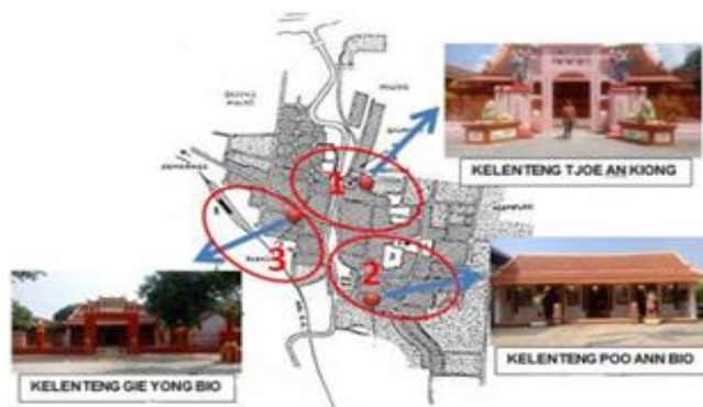
Gambar 1. Pembagian Unit Amatan

Penelitian ini merupakan penelitian dengan Paradigma Post Positivistik Naturalistik. Paradigma Penelitian Kualitatif digunakan jika ingin melakukan suatu penelitian yang lebih rinci yang menekankan pada aspek detail yang kritis dan mendalam (Indriantoro & Supomo, 1999: 12-13). Penelitian Kualitatif merupakan proses upaya untuk mengetahui mengenai suatu masalah social atau kemanusiaan, berdasarkan pada usaha membangun suatu gambar yang kompleks dan menyeluruh, dibentuk dengan kata-kata atau deskripsi, dengan melaporkan pandangan-pandangan rinci dari informan, dilakukan dalam setting yang alamiah. Penelitian Karakteristik Kawasan Pecinan Lasem ini menggunakan pendekatan grounded theory , sesuai dengan tujuannya untuk menggali teori lokal terkait karakteristik ruang Pecinan Lasem. Strategi yang digunakan adalah strategi induktif sesuai dengan permasalahan penelitian yang dihadapi. Lokus penelitian meliputi lima desa yaitu: Desa Babagan, Desa Soditan, Desa Gedong Mulyo, Desa Karangturi dan Desa Sumber Girang tersebut kemudian dibagi menjadi tiga unit amatan. Unit amatan I adalah Unit Amatan Desa Soditan dan sebagian Desa Gedongmulyo dimana terdapat Kelenteng Tjoe An Kiong sebagai pusat kawasan. Unit Amatan II adalah Unit Amatan Desa Karang Turi dan sebagian Desa Sumber Girang dimana terdapat Kelenteng Poo An Bio sebagai pusat kawasan Unit Amatan II. Unit Amatan III adalah Unit Amatan Desa Babagan dimana terdapat Kelenteng Gie Yong Bio sebagai pusat kawasan Unit Amatan III.