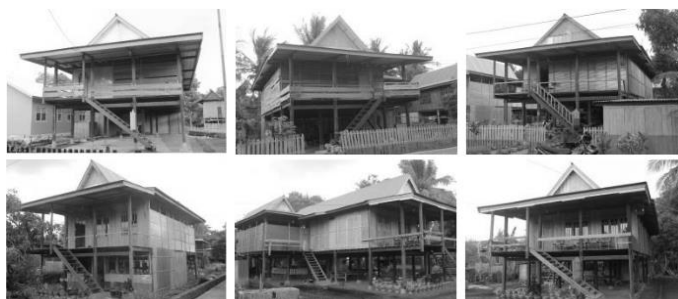
Gambar 4. Prototipe rumah-rumah berarsitektur tradisional Bugis di jalan poros Desa Enrekeng, Kecamatan Ganra Kabupaten Soppeng, Sulawesi Selatan

Gambar 4 di atas memperlihatkan prototipe tampilan fasade arsitektur tradisional Bugis, bangunan berpanggung, beratap bentuk pelana bahan seng gelombang, dinding perpaduan bahan papan kayu, dan kaca, dan bertangga kayu. Walaupun demikian penerapan konsep-konsep nilai kearifan lokal masih dapat dijumpai, mulai dari pemilihan material bangunan, menentukan lokasi bangunan, proses konstruksi, mendirikan bangunan, dan naik "rumah baru".