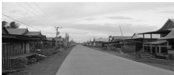
Gambar 3. Rumah-rumah berarsitektur tradisional Bugis, secara linear sepanjang jalan Desa Enrekeng, Kecamatan Ganra Kabupaten Soppeng, Sulawesi Selatan