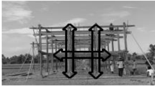
Gambar 2. Bentuk Struktur dan Konstruksi menyerupai Huruf "H"

Kemampuan masyarakat Bugis membangun dan mendirikan rumah panggungnya, hampir tidak mengalami perubahan sampai saat ini, kalau memperhatikan gambaran rumah panggung menurut Matthes (1874); dan membandingkan rumah panggung yang ada sekarang tidak terlalu jauh perbedaannya. Demikian pula dalam hal membangun atau mendirikan rumah panggung, selalu dilaksanakan secara bersama-sama dalam suasana gotong-royong. Fox (1993) menyebutkan bahwa orang Bugis-Makassar memiliki keahlian teknis dalam membangun dan merekonstruksi rumahnya, dan juga terlihat keahlian mereka baik dalam pembangunan kapal kayu (pinisi) dan pendirian rumah merupakan suatu ciri khas budaya mereka di nusantara.