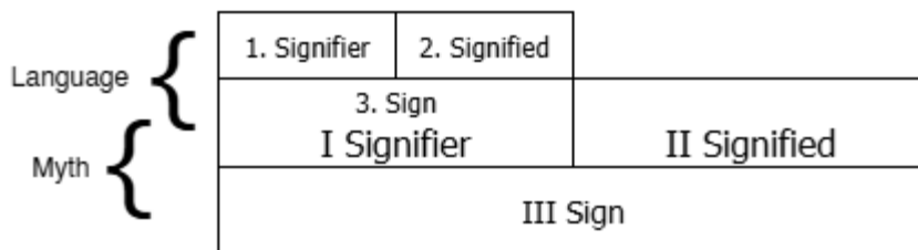
Gambar 1. kerangka semiotika Roland Barthes

Pendekatan Barthes seperti terlihat pada Gambar 1 ini menjadikan arsitektur sebagai medan komunikasi budaya, tempat mitos beroperasi dengan menyamarkan kepentingan tertentu dalam bentuk yang tampak objektif dan estetis. Oleh karena itu, teori Barthes sangat relevan untuk membongkar makna tersembunyi dalam desain arsitektur kontemporer, khususnya dalam konteks politik ruang, kapitalisme visual dan representasi sosial.